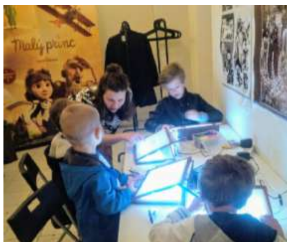
Animovaná dílna pro děti i dospělé