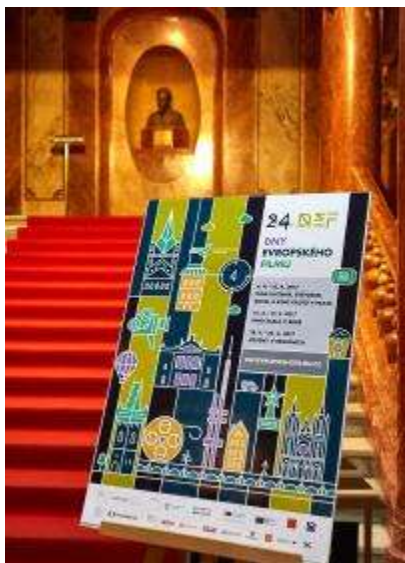
Plakát DEF u vstupu do kina Lucerna