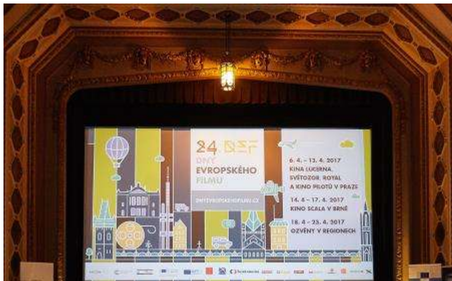
Vizuál DEF při projekci v kině Lucerna

Vstupné na jednotlivé projekce DEF v Praze a Brně činilo 110 Kč . Pro seniory bylo připraveno vstupné za 55 Kč + seniorská projekce v Lucerně. Vstupenky na všechny filmy bylo možné zakoupit přes online prodej . Vstupenky šlo také rezervovat telefonicky nebo emailem. Veškeré informace o programu, jeho změnách, cenách vstupenek atd., našli diváci na webu www.dnyevropskehofilmu.cz .