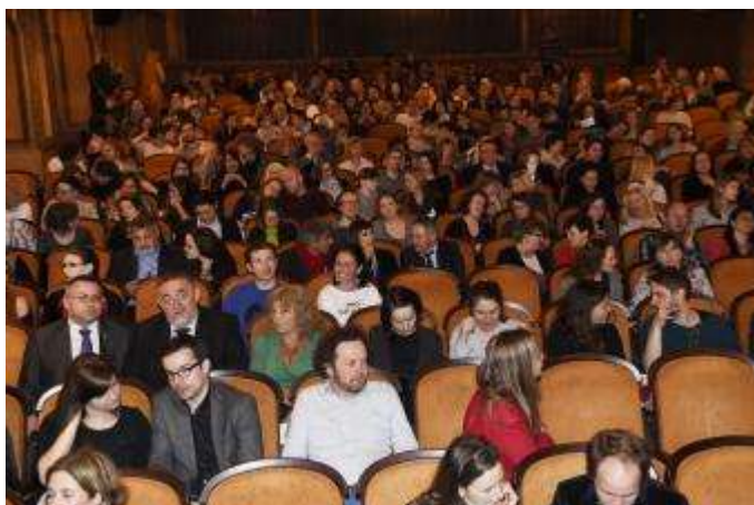
Zaplňný sál kina Lucerna

Podrobný program DEF v jednotlivých městech, přehled a popis sekcí, katalog ke stažení, fotografie, novinky, informace k doprovodnému programu apod., diváci našli na webu www.dnyevropskehofilmu.cz a na FB 24. DEF. Pokračujeme v trendu, kdy se místo velkým tištěným materiálům věnuje více energie a pozornosti prezentaci na webu a sociálních sítích. Stejně jako v předchozích letech byla kampaň na sociálních sítích opřena především o aktuální informace o nejdůležitějších částech programu, důležitých datech, speciálních akcích a doprovodném programu. Zaznamenali jsme poměrně značný nárůst nových uživatelů FB, kteří si profil DEF zařadili mezi své oblíbené stránky. FB DEF tak sleduje přes 2 500 uživatelů. Během 14 dnů konání festivalu jsme zaznamenali dosah 5-9 tisíc denně.