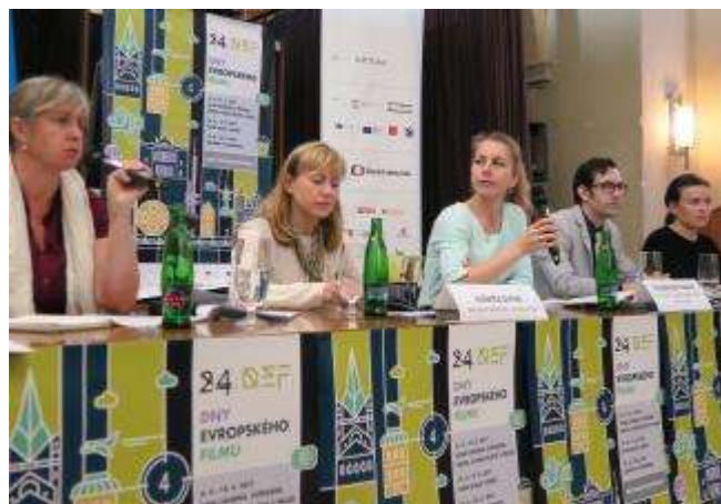
Tisková konference 24. DEF

Na řadu snímků byly kinosály vyprodány. V předprodeji bylo prodáno více než 2 000 vstupenek. Celková návštěvnost byla přes 14 000 diváků.