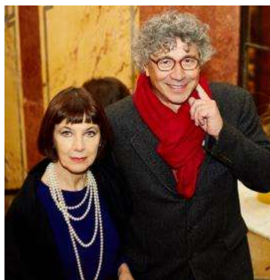
Italský režisér Giancarlo Soldi se ženou na projekci filmu Pět světů