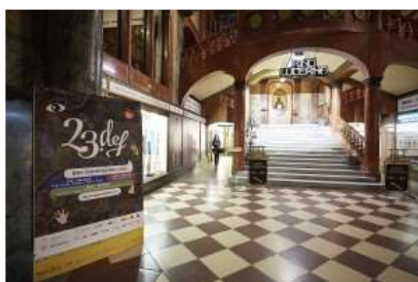
Ukázka indoorové reklamy