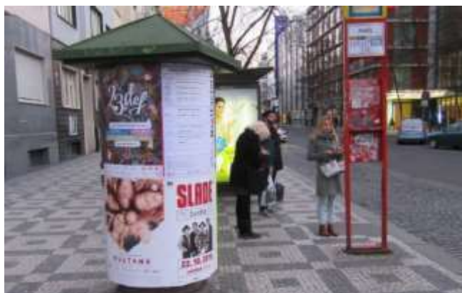
Ukázka outdoorové reklamy